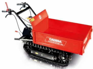
Camisa TP 280/TP 285