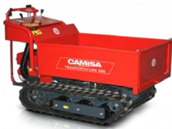
Camisa TP 500