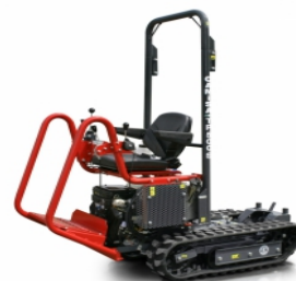
Camisa TP 580